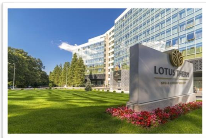
Lotus Therm SPA & Luxury Resort

De asemenea, Turism Felix deține o participație de 30,33% din capitalul social al societății Turism Lotus Felix S.A. , care deține singurul complex balnear de cinci stele din România (Lotus Therm SPA & Luxury Resort), situat în Băile Felix și care a fost inaugurat în Octombrie 2015.