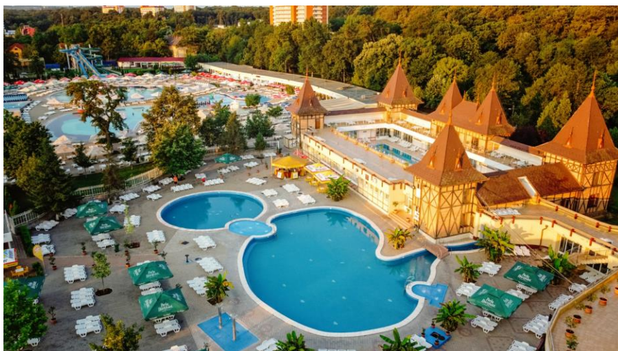
Ștrand Apollo Felix

- trei ștranduri (Apollo, Felix și Venus) și Clubul Dark cu o capacitate de 300 de locuri.